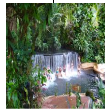
비교적 원시적인 노천온천 - 아비몬 국립공원